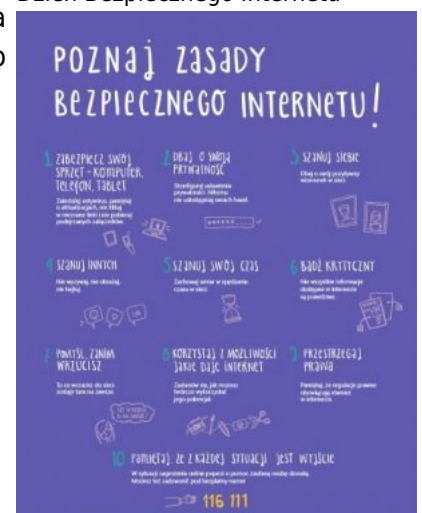
Dzień Bezpiecznego Internetu