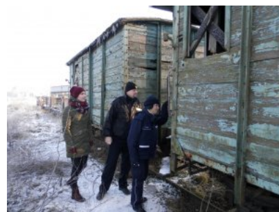
Wspólne działania w trosce o osoby bezdomne.