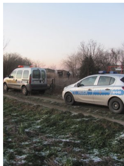
Wspólne działania w trosce o osoby bezdomne.